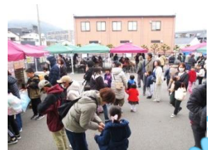
(屋外バザーの様子)