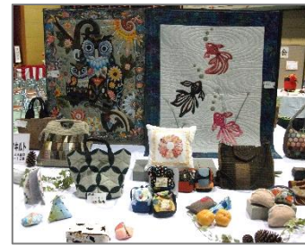
▲過去の公民館まつりの様子

公民館活動グループ「パッチワークキルト」さんの作品展を1階ロビーで開催します。とても素敵な作品です。ぜひご覧ください。